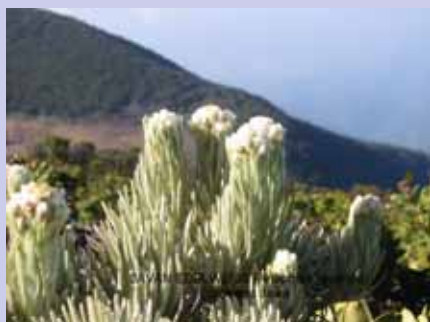
「永遠の花」エーデルワイス

私たちはこのかけがえのない自然の遺産を後世に残し、自然の与えてくれた貴重な贈り物を皆さんと分かち合いたいです。